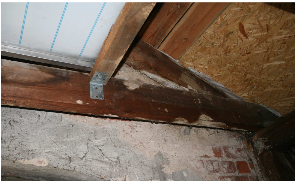
Fot. nr 8 Zawilgocony i porażony przez grzyby kleszcz