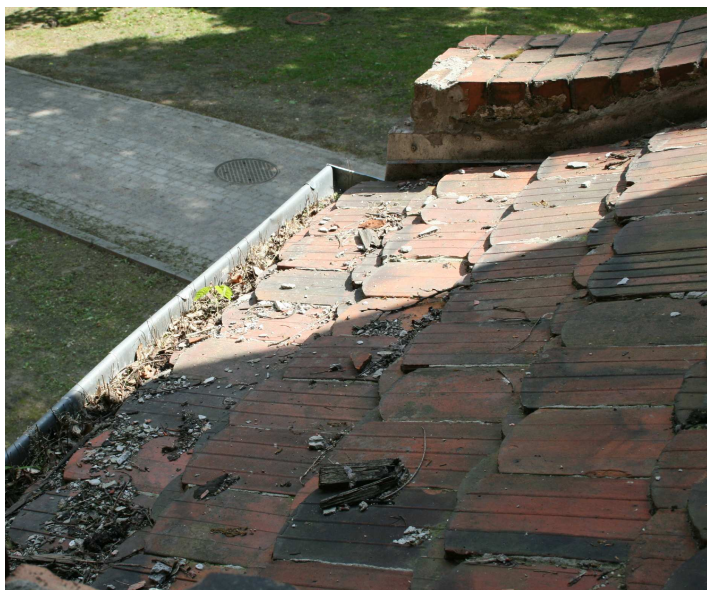
Fot. nr 1 W złym stanie pokrycie dachowe(zmurszałe dachówki) i niedrożne rynny.