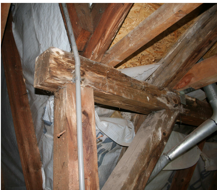
Fot. nr 6 Zawilgocona, zagrzybiona i spróchniała płatew