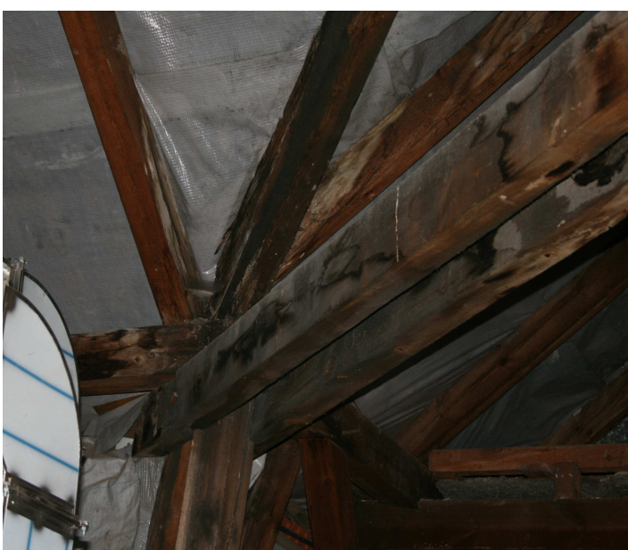
Fot. nr 5 Nadpalone i okopcone belki w narożniku.