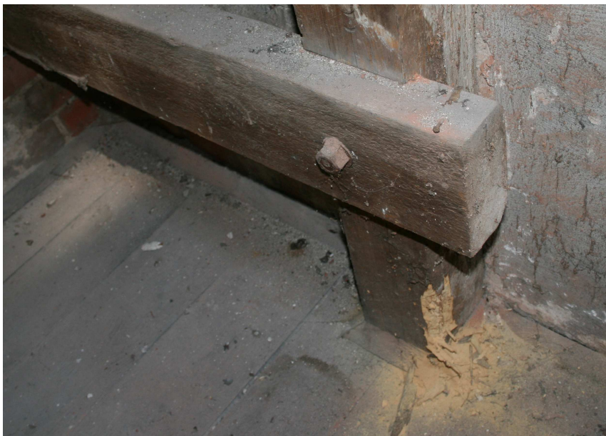
Fot. nr 7 Porażona przez owady, techniczne szkodniki drewna, podstawa słupa