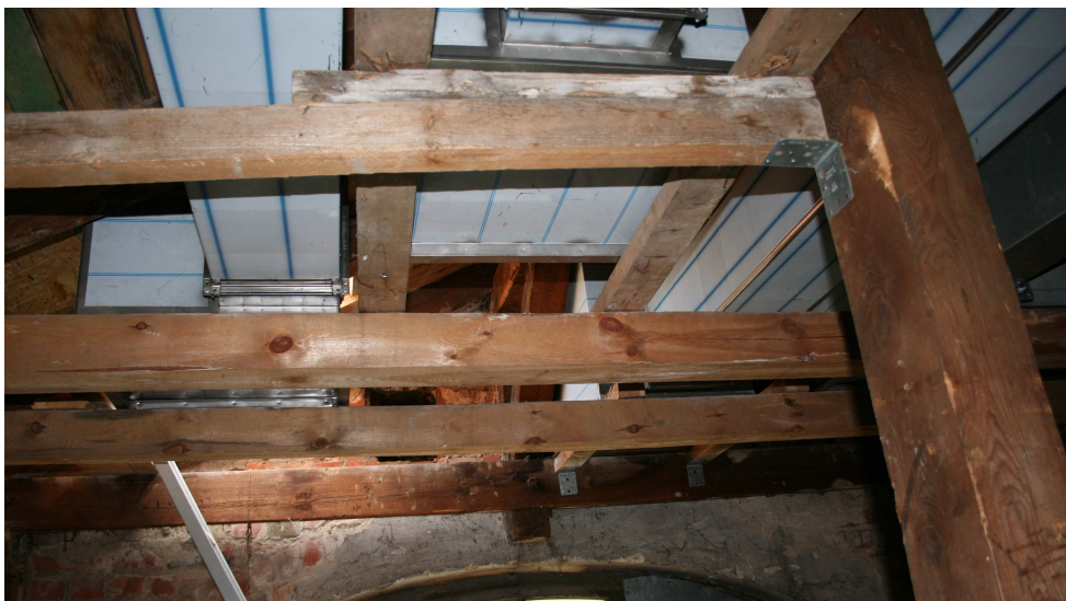
Fot. nr 9 Nadmiernie ugięte belki – konstrukcja wsporcza pod urządzenia centrali wentylacyjnej