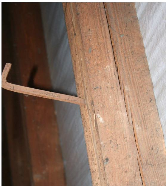
Fot. nr 3 Większość elementów konstrukcji więźby dachowej jest znacznie popękana(efekt zbyt szybkiego wysychania drewna)