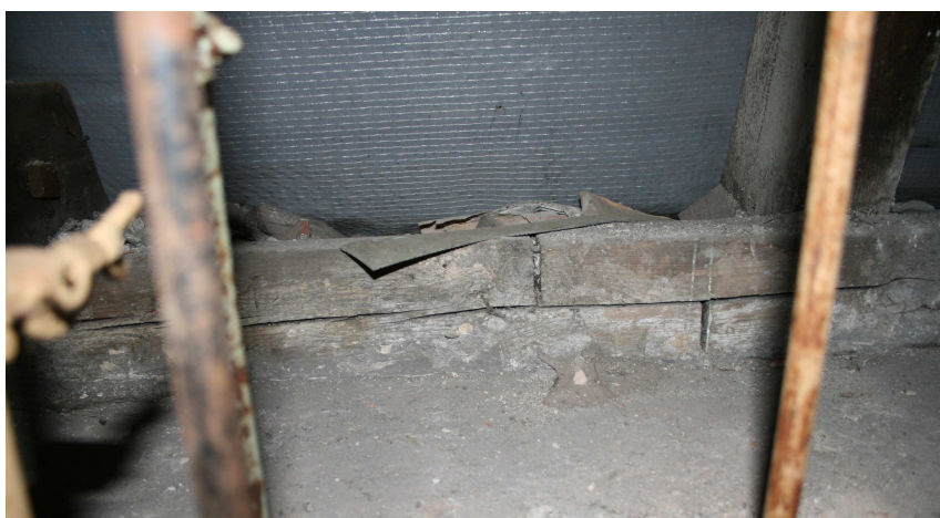
Fot. nr 11 Popękana murłata