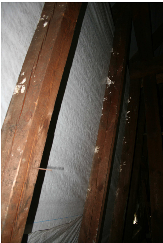
Fot. nr 10 Krokwie mansardy dolnej wyraźnie popękane – (efekt zbyt szybkiego wysychania drewna) oraz porażone przez grzyby.