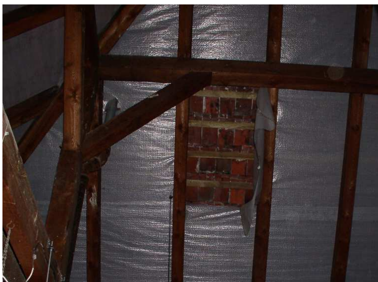
Fot. nr 12 Uszkodzona folia